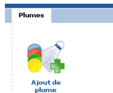
Figure 2 : Rubrique Ajout de plume