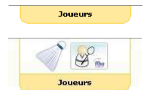
Figure 1 : Languette Joueurs

Vous accéderez alors à la seconde étape.